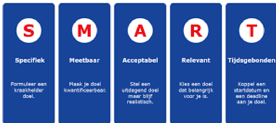
Doelen stellen via SMART methode